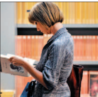
Sopra, una ragazza alle prese con la lettura di un libro

La kermesse prosegue domani al Teatro Strehler alla presenza di lettori speciali, da Armando Torno a Franca Nuti fino a Giancarlo Dettori, protagonisti dell'evento "Il libro che ha cambiato la mia vita è...". Alle 21 in Duomo anche il cardinale Dionigi Tettamanzi affronterà la questione fra ricordi e riflessioni. Gran finale domenica con una giornata di letture in tutta la città. Al futuro sono dedicati i reading sul tram 31 (ore 10-18) e alla Costituzione Italiana la lettura con Giulia Lazzarini al Tribunale di corso di porta Vittoria (10.30). Info www.comune.milano.it/lettura .