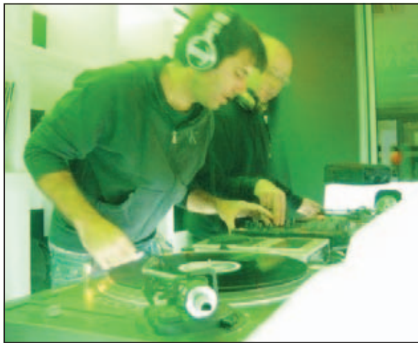
Il djset Radiozerogravity ospite allo Spring Hippy party

Domenica speciale all'Atomic dove si esibirà James Yuill, cantautore londinese la cui musica è un misto tra electro e folk; un ritorno gradito invece per i più trasgressivi con la nuova collocazione della serata Papè Satan che da questa settimana riapre i battenti al Thini.